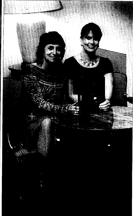
En la foto de la izquierda, los escritores de novela negra Petros Márkaris, Andreu Martín y Francisco González Ledesma (de izquierda a derecha); en la foto de al lado, las ganadoras de los premios que conceden los lectores de la revista de libros Qué Leer, Rosa Montero y Elizabeth Kostova (de izquierda a derecha).